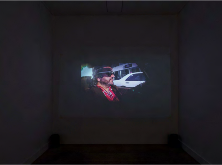
Tunç Ali Çam, ‘Bir Koleksiyoncunun Anatomisi’, 2023. Enstalasyon, değişken ölçüler Tunç Ali Çam, ‘The Anatomy of a Collector’, 2023, Installation, dimensions variable