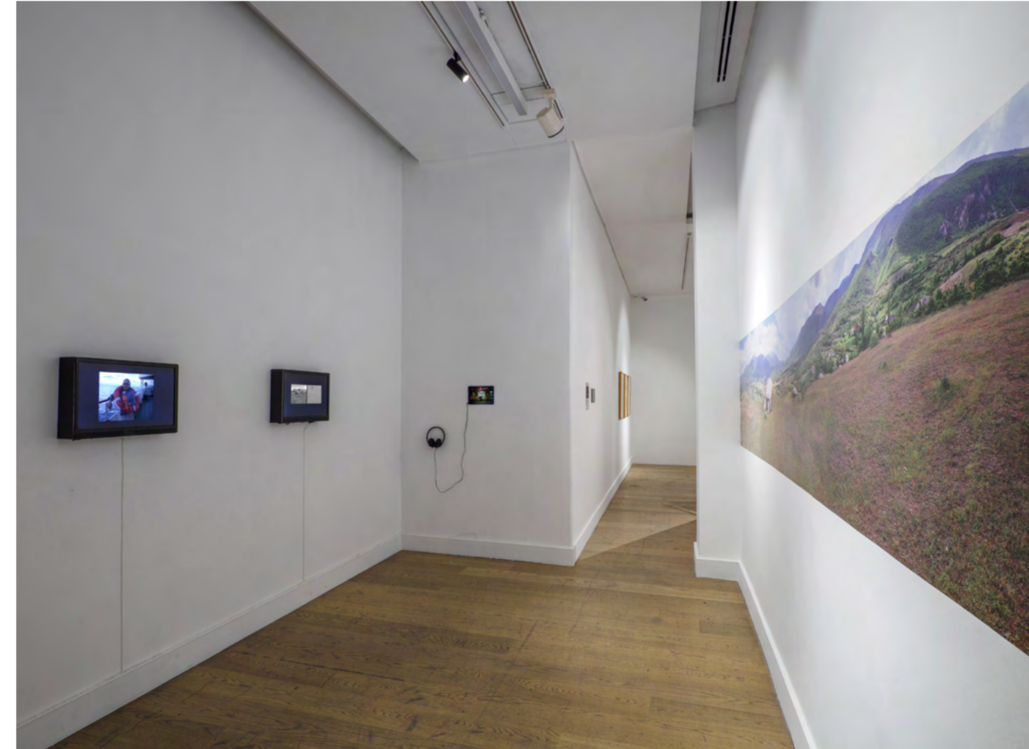
Thomas Büsch, 'Mobil Cihazların İcadı', 2023. Enstalasyon, değişken boyutlar Thomas Büsch, 'Invention of the Mobile Devices', 2023. Installation, dimensions variable