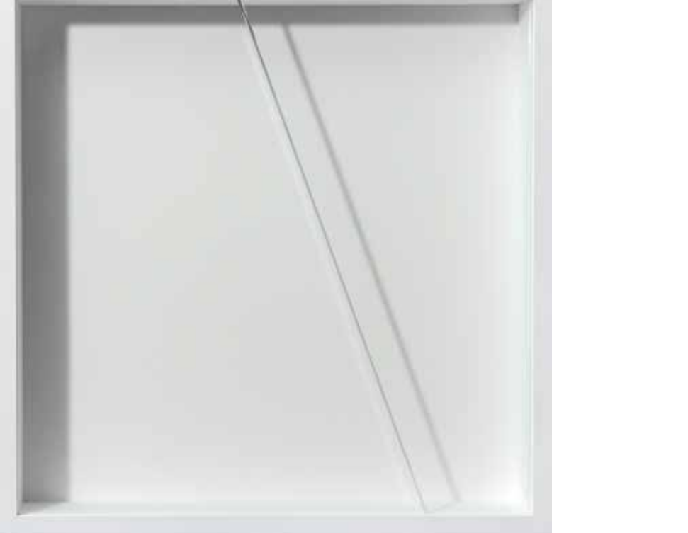
Nuri Kuzucan, Maket 2, 2020, ahşap, cam ve kağıt, 40 x 40 cm, Ed. 5 + 1 AP