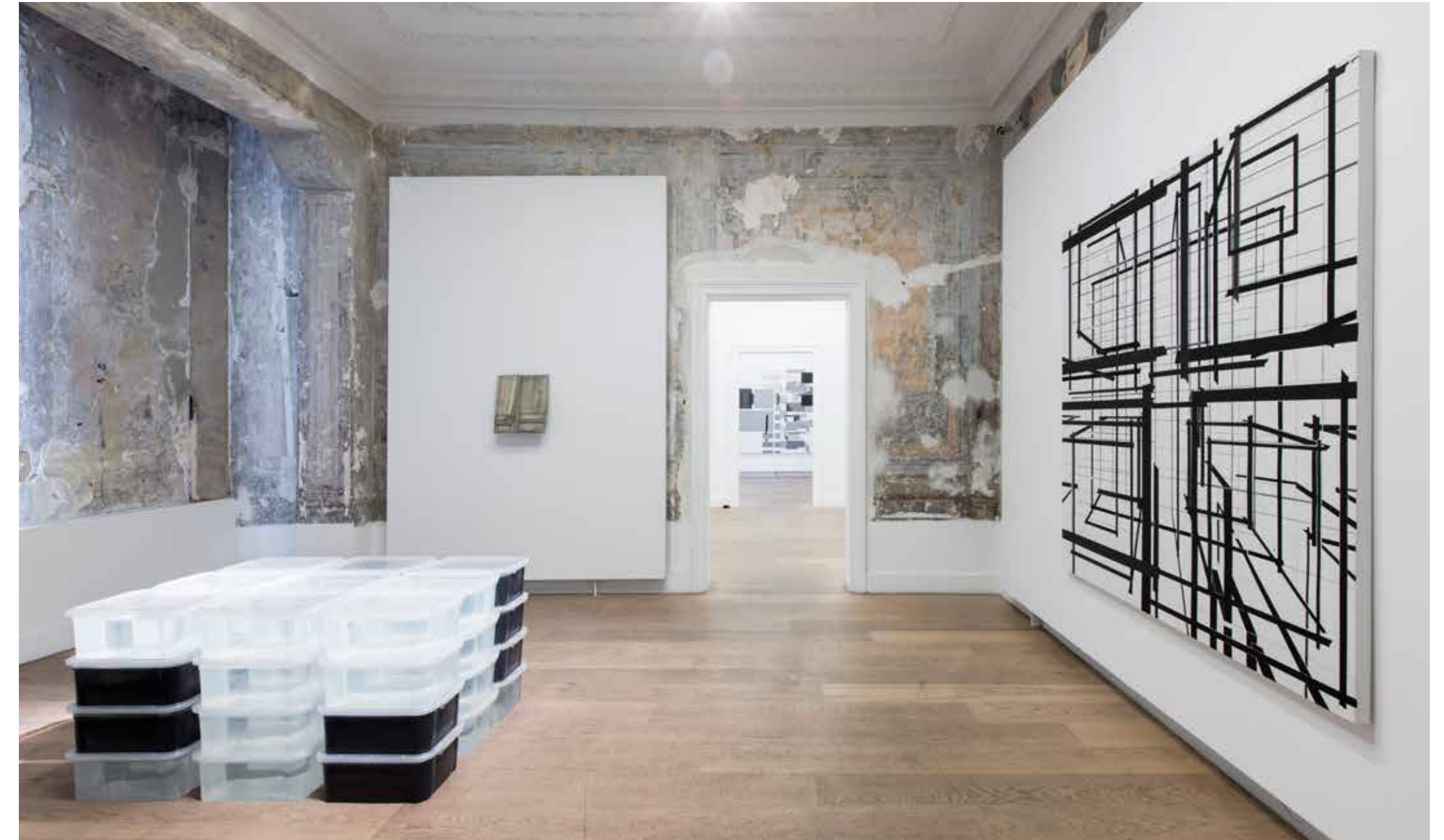
Sinan Logie, Akışkan Yapılar - Faz 20 , 2020, plastik kutu, su, mürekkep, 73 x 96.5 x 145.5 cm Sinan Logie, Fluid Structures - Phase 20 , 2020, plastic box, water, ink, 73 x 96.5 x 145 cm