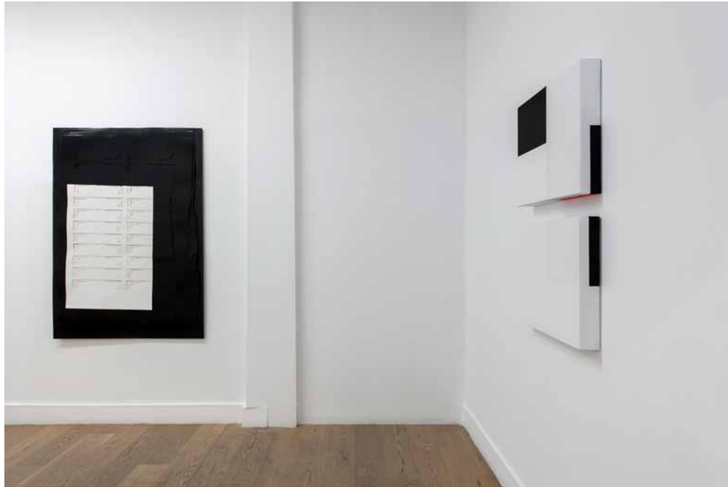
Seçkin Pirim, Sonuçlanan Süreç #2 , 2020, bristol kağıt kesim, 123 x 172 cm