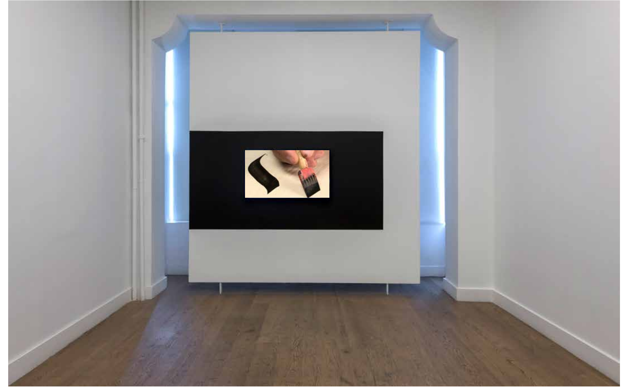
Ali Kazma, Kaligrafi (Rezistans Serisi) , 2013, tek kanallı HD video, renk, 6 dk., Ed. 5 + 2 AP, İstanbul Kültür Sanat Vakfı (İKSV)'nin izniyle Ali Kazma, Calligraphy (Resistance Series) , 2013, single channel, HD video, colour, 6 min., Ed. of 5 + 2 AP, Courtesy of Istanbul Foundation for Culture and Arts