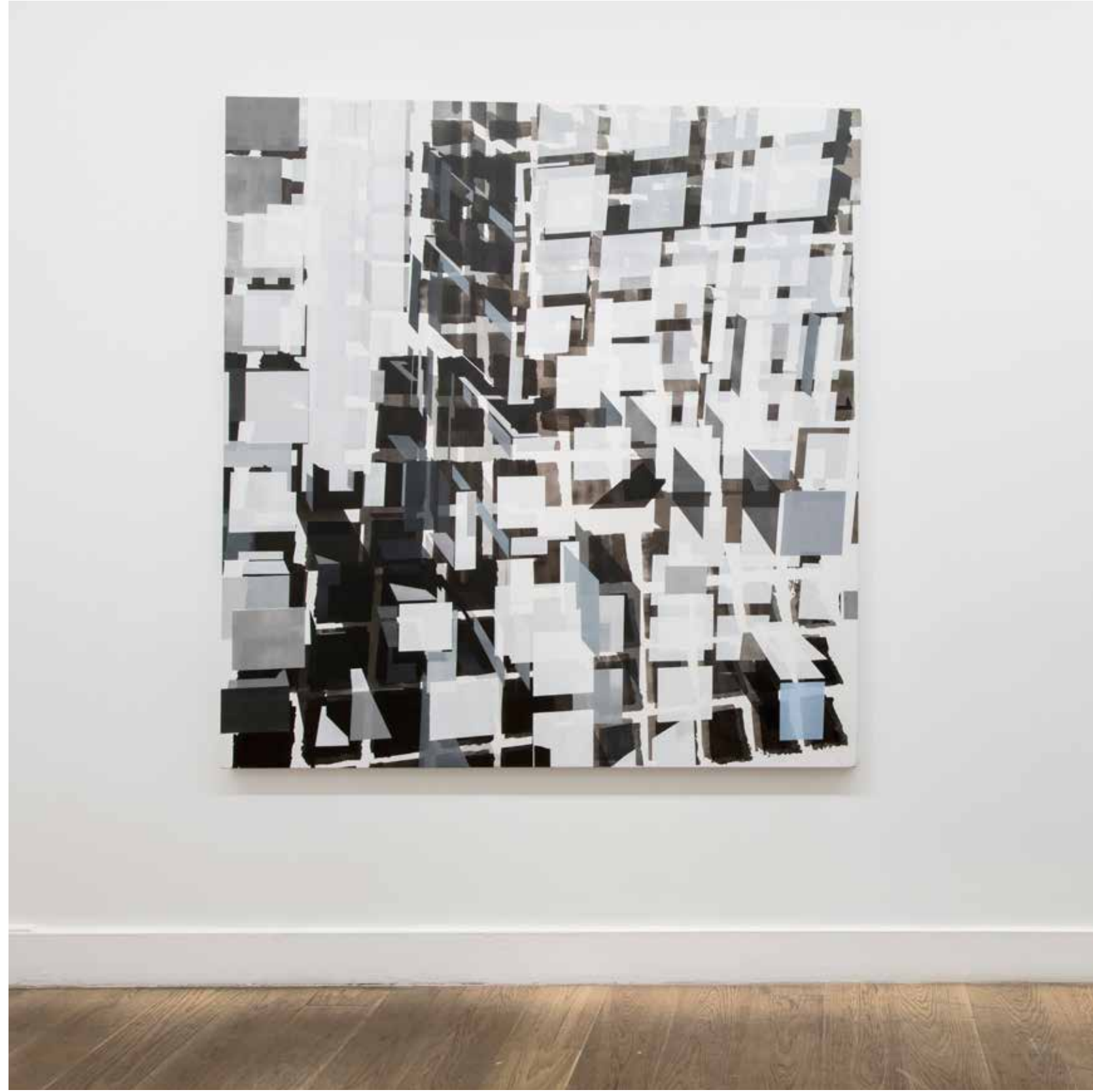
Nuri Kuzucan, Re-konstrüksiyon , 2020, tuval üzerine akrilik boya, 195 x 185 cm Nuri Kuzucan, Re-construction , 2020, acrylic on canvas, 195 x 185 cm

Canan Tolon, Dağca , 1997, kağıt üzerine mürekkep, 29 x 21.5 cm (çerçevesiz), 51 x 51 cm (çerçevesel), Özel Koleksiyon Canan Tolon, Dağca , 1997, ink on paper, 29 x 21.5 cm (unframed), 51 x 51 cm (framed), Private Collection