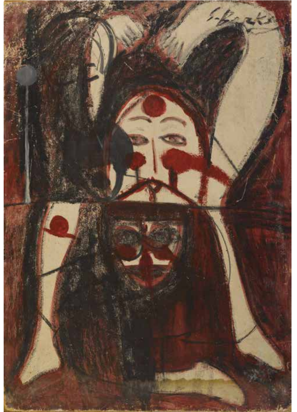
OTOPORTRE; DURALİT ÜZERİNE YAĞLIBOYA, 99X69 CM 'SELF PORTRAIT'; OIL ON MASONITE, 99X69 CM