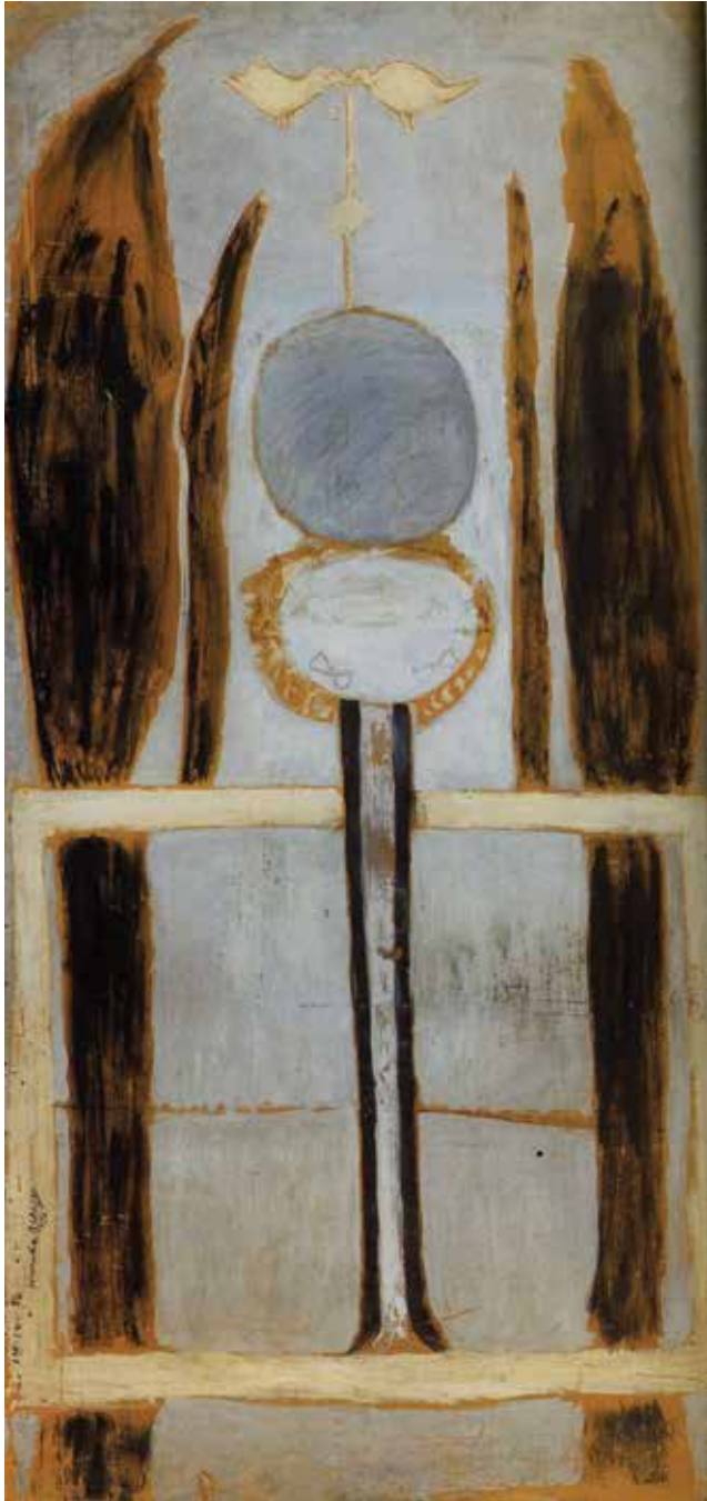
'SONSUZLUĞUN AŞKA DAYANAN BİRLİĞİ'; 1976, SUNTA ÜZERİNE YAĞLIBOYA, 244X121 CM 'THE HARMONY OF ETERNITY FOUNDED ON LOVE'; 1976, OIL ON FIBERBOARD, 244X121 CM