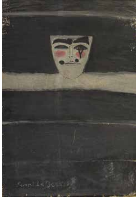
'GÖREN OTOPORTRE', 1969, DURALİT ÜZERİNE YAĞLIBOYA, 99X69 CM 'SEEING SELF PORTRAIT', 1969, OIL ON MASONITE, 99X69 CM

Semiha Berksoy'un 1929 yılında başlayan opera kariyeri bir çok ülke ve nice zorlukları aşarak, 1972 yılında kendi emekliliğini isteyene kadar, yani otuzu aşkın sene devam eder. Yüksek dramatik soprano olan sanatçı dönemin marjinal sayılan politik kimlikleri ile olan dostlukları, görkemli sesini taşıyabilecek alt yapı eksiklikleri ve dik başlılığı başta olmak üzere, çeşitli sebeplerden dolayı dönem dönem sahnedan uzaklaştırılır. Gerek Devlet Operasının üst düzey kişileri, gerek akademisyenlerden alınan sayısız rapor ve belge ile defalarca kendini kanıtlamak zorunda bırakılır. 'Gülen' ve 'Gören' bu buhranlı dönemlere ithafen yapılmıştır. Berksoy tiyatro ve operada bir duygu yoğunluğunu tek bir ifadeyle aktarma tecrübesini, resimlerinde kullanarak naif ve sade çizgilerle hayalkırlığını ve bilgeliğini aktarır. "Ölümlü yaşamın, geçmişle geleceğin bir olduğunu, zaman mefhumunun bulunmadığını işaret" ettiğini söylediği çizginin altından ve karanlık duygulardan sıyrılmış şekilde resmeder kendini. Arkasında dönen dolapları, onu nasıl engellemeye çalıştıklarını izler. Gözünden kara bir gözyaşı süzülür fakat o, cesareti asla elden bırakmadan, yaşadığı tüm zorluklara ve kalp kırıklıklarına inat gülümsemeye devam ederek, kimliğini ve yeteneğini tüm çıplaklığıyla göz önüne sererek, üretmeye, çalışmaya ve bir sanat yapıtı olarak yaşamaya devam eder.