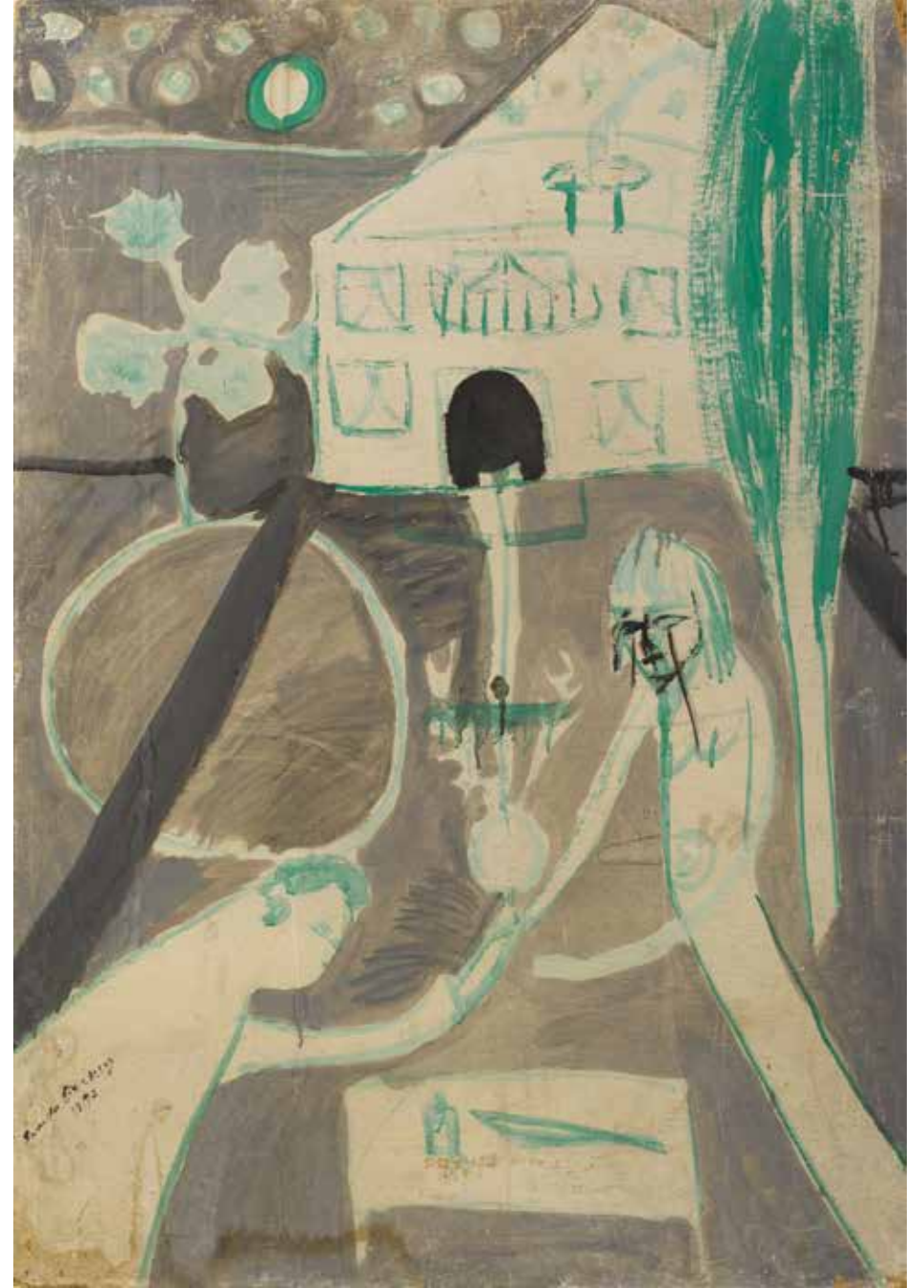
'MEZARDAN GELEN MEKTUP'; 1972, DURALİT ÜZERİNE YAĞLIBOYA, 100X69 CM 'LETTER FROM BEYOND THE GRAVE'; 1972, OIL ON MASONITE, 100X69 CM