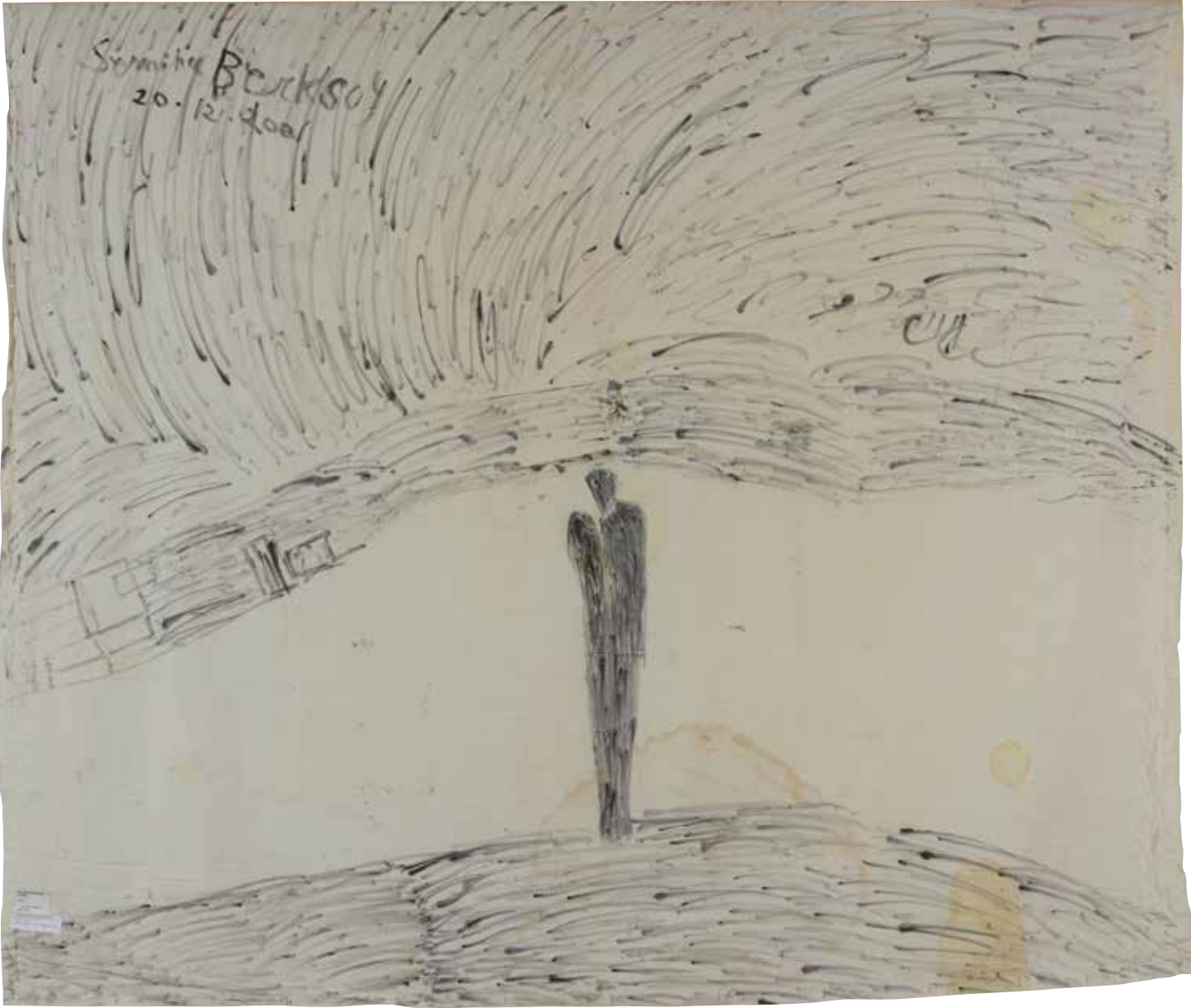
'BİR RÜYA'DA BULUŞAN SEVGİLİ'; 2001, ÇARŞAF ÜZERİNE YAĞLIBOYA, 207X241,5 CM 'LOVERS MEET IN A DREAM'; 2001, OIL ON LINEN, 207X241,5 CM

2002'de, Nazım Hikmet'in doğumunun 100. yılında, Devlet Tiyatrosu 'Bu bir rüyadır' operetini sahneye koyar. Nazım Hikmet'in Semiha Berksoy için yazdığı operetin final sahnesini Semiha Berksoy oynar. Oyunun hemen öncesinde, kuliste gece rüyasında Nazım Hikmet'i gören Semiha Berksoy Melih Güneş'ye rüyasını anlatıyor: "Seni rüyamda görmüştüm. Kainat karanlık içerisinde. Seni görüyorum. Sen duruyorsun. Ben de yanındayım. Çok yakınım, sarılmış gibi. Karanlık böyle, İstanbul Boğazı silüeti görünüyordu. Kainat simsiyah fakat öyle bir siyahlık ki içinden bir aydınlık var. Ben bir korkuyla uyandım; derken bende Muhyiddin Arabi'nin rüya kitabı var hemen onu açtım, büyük filozofun...Bir de baktım rüyada karanlığı görmek nur-u zulmet diyor. Nur, karanlığın nurunda duruyorsun sen."