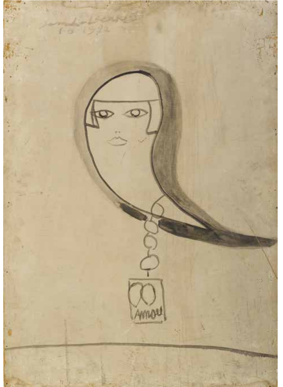
AŞK OTOPORTE ; 1972, DURALİT ÜZERİNE YAĞLIBOYA, 100X70 CM 'LOVE SELF PORTRAIT'; 1972, OIL ON MASONITE, 100X70 CM