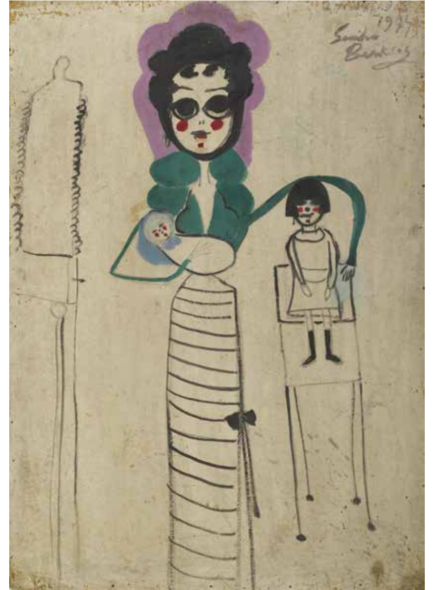
'ANNEM VE BEN', 1974, DURALİT ÜZERİNE YAĞLIBOYA, 100X70 CM 'MOM AND I', 1974, OIL ON MASONITE, 100X70 CM