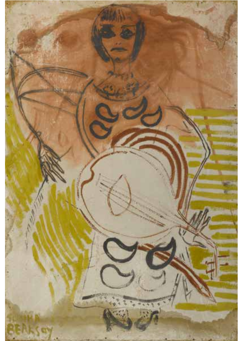
'ANNEM UD ÇALARAKEN', 1958, DURALİT ÜZERİNE YAĞLIBOYA, 99X69 CM 'MOM PLAYING LUTE', 1958, OIL ON MASONITE, 99X69 CM