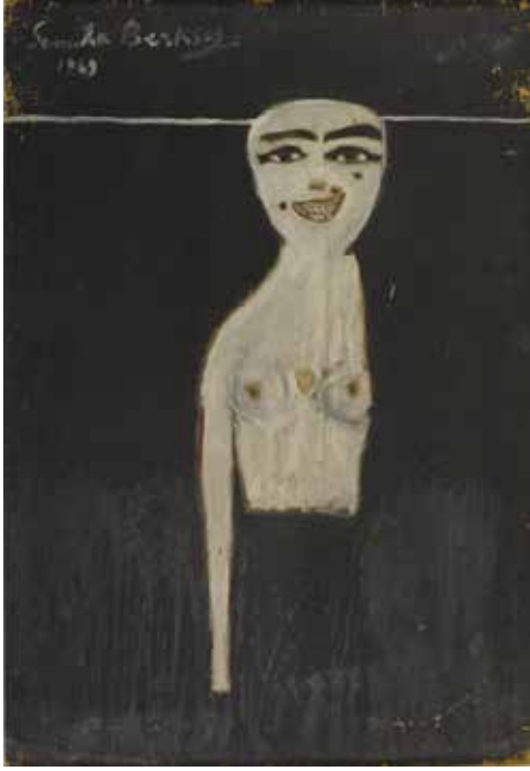
'GÜLEN OTOPORTRE', 1969, DURALİT ÜZERİNE YAĞLIBOYA, 98X69 CM 'LAUGHING SELF PORTRAIT', 1969 OIL ON MASONITE, 98X69 CM