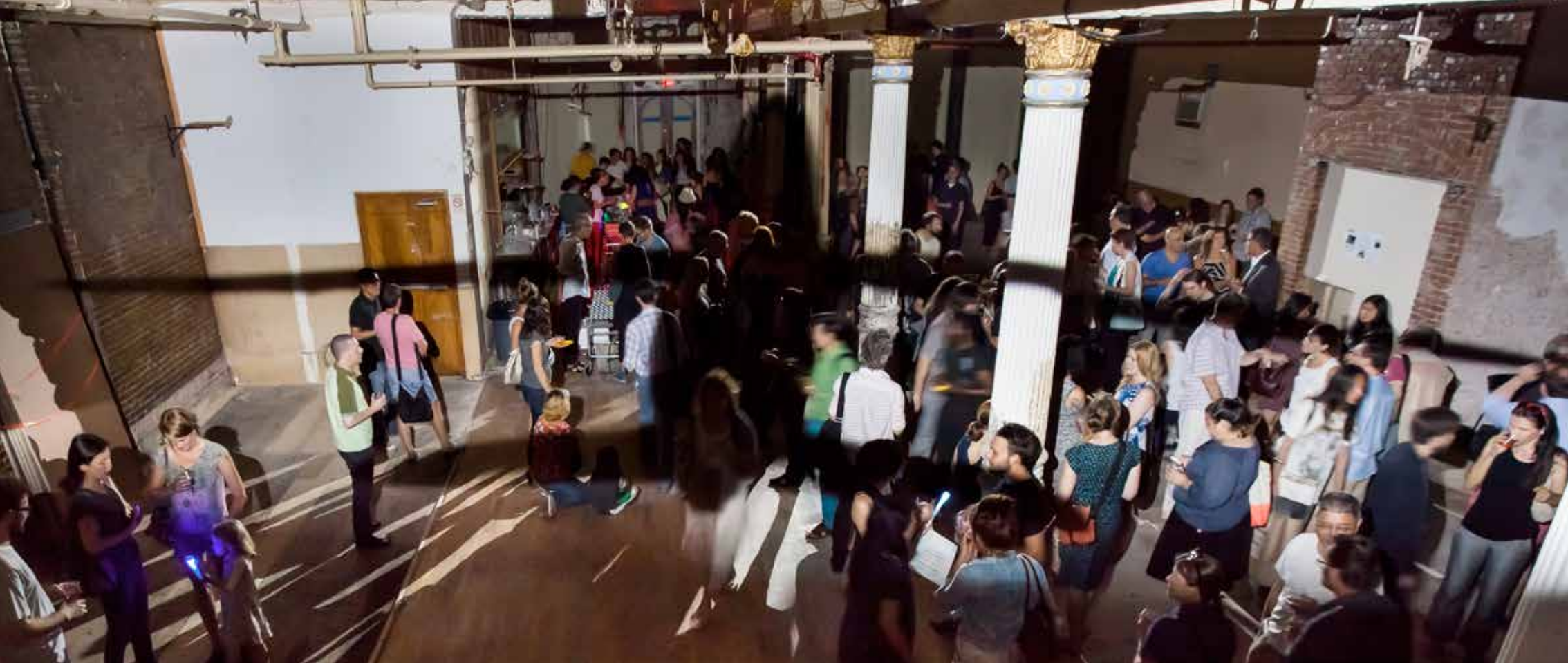
"MIRAGE", 2012, FOTOĞRAF, 3+1AP "MIRAGE", 2012, PHOTOGRAPH, 3+1 AP