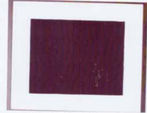
Untitled (after Ruskin)