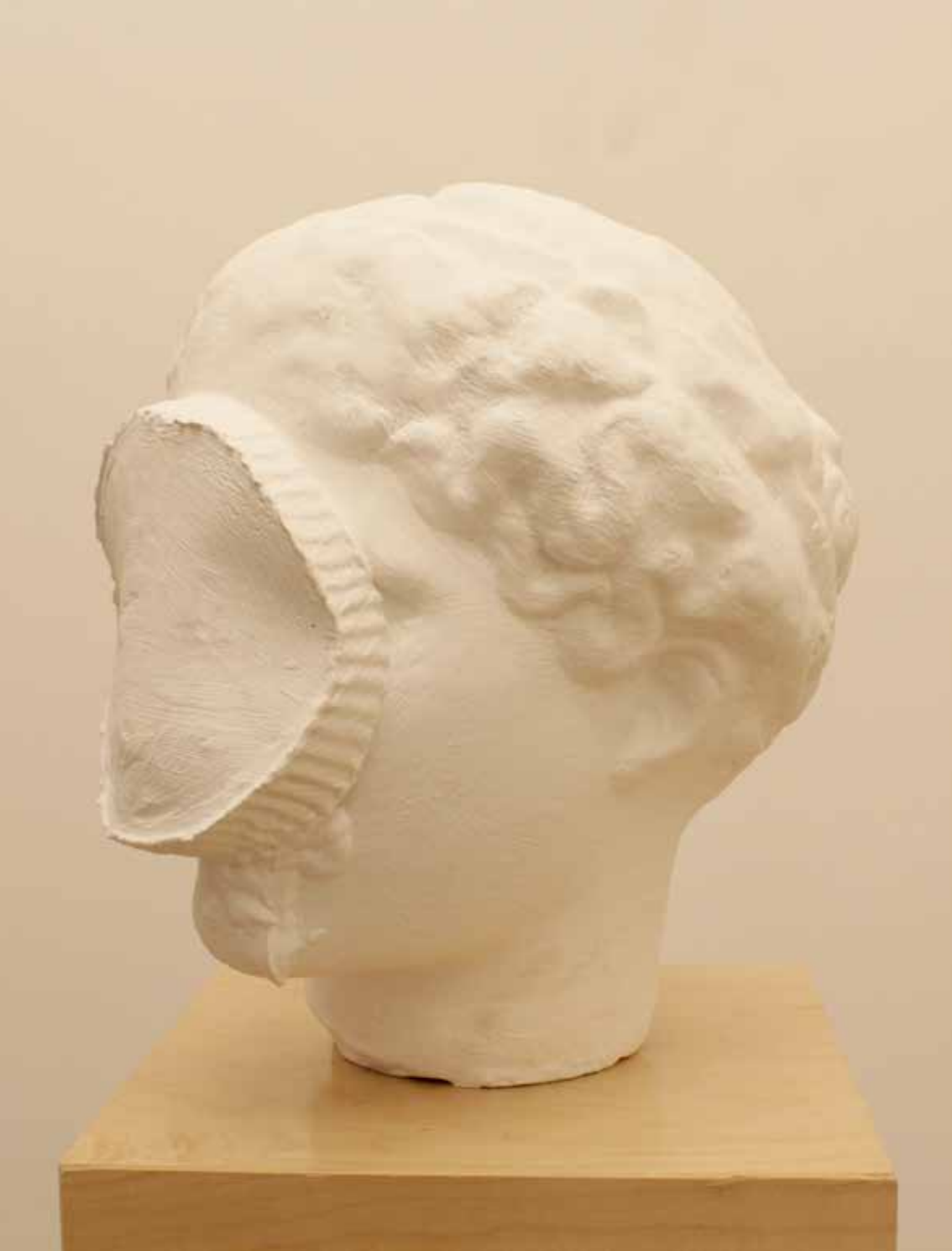
'I II', 2014, HEYKEL, ALÇI, 42X35X35CM 'I II', 2014, SCULPTURE, PLASTER, 42X35X35CM