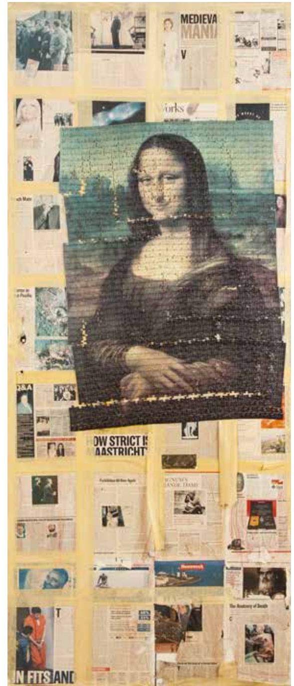
"MONA LISA", 1998, KARIŞIK TEKNİK, 200X85CM MONA LISA", 1998, MIXED MEDIA, 200X85CM