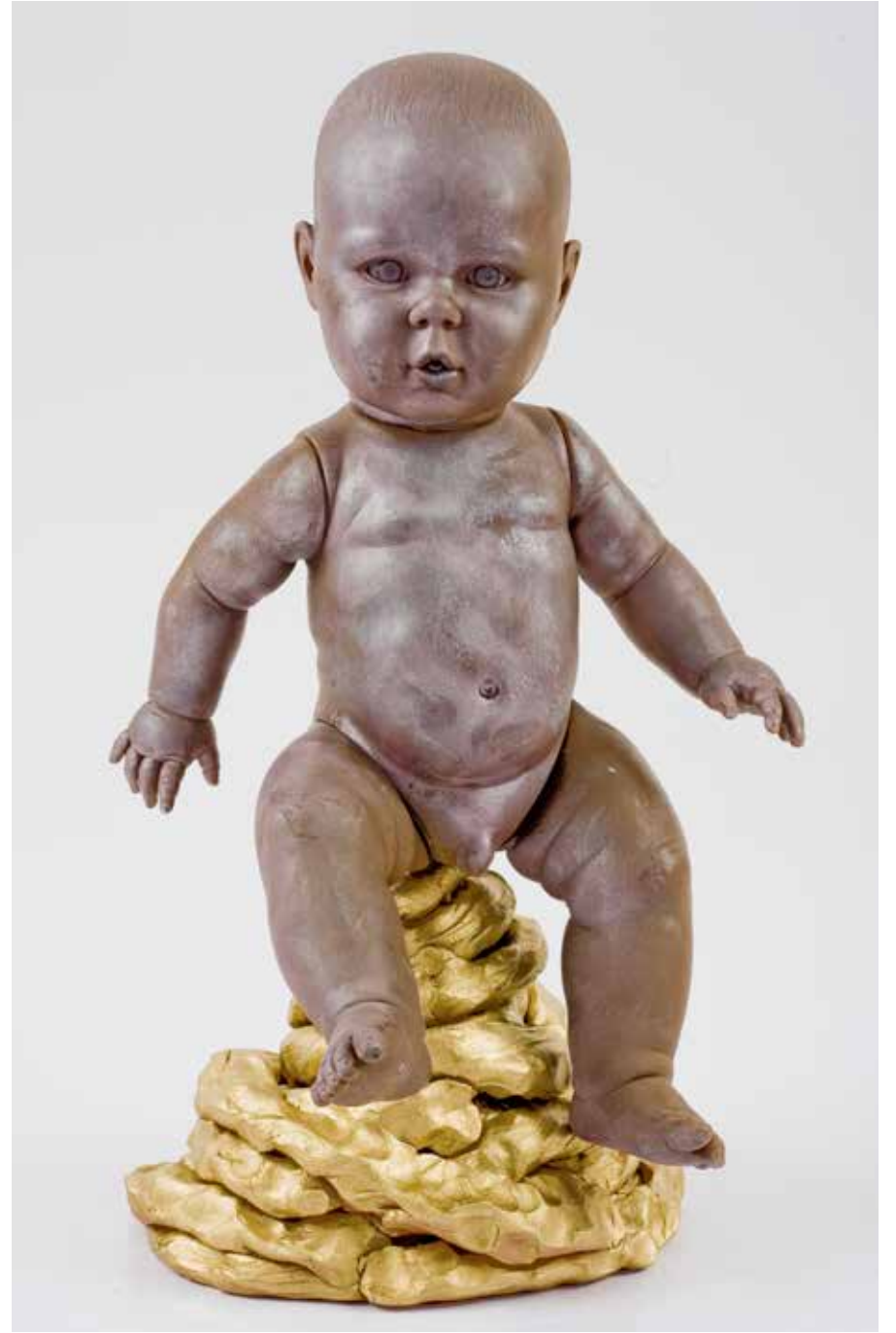
"DIŞKI İLE İRTİFA", 2009, KARIŞIK TEKNİK "LEVITATION BY DEFECAATION", 2009, MIXED MEDIA