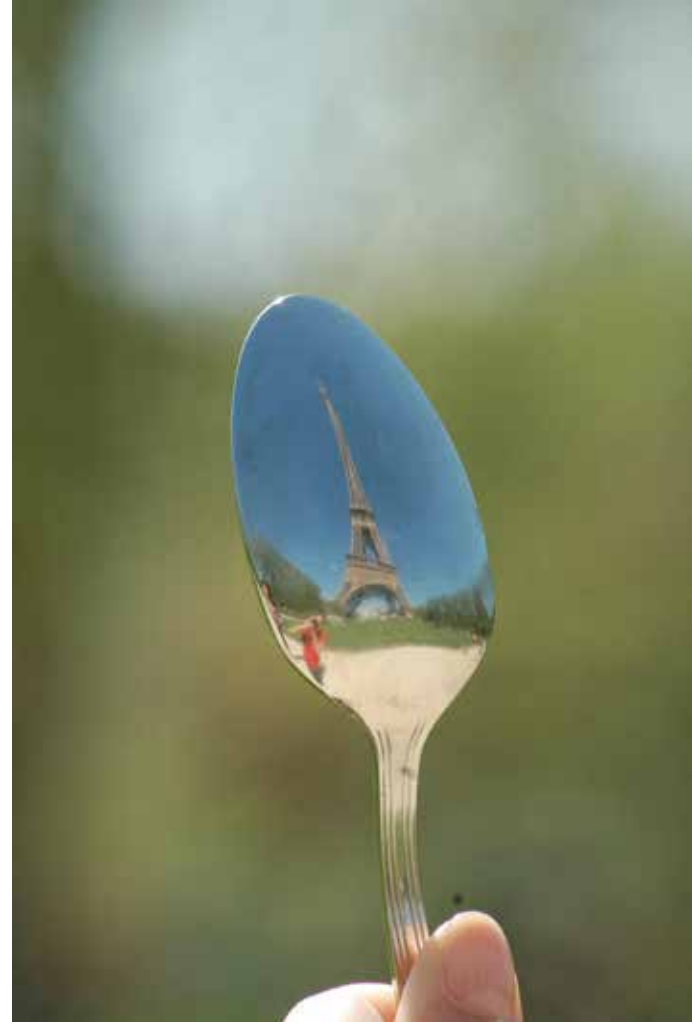
"ÇILGIN TURİST", 2006, VIDEO, 3+2 APO "CRAZY TOURİST", 2006, VIDEO, 3+2 APO