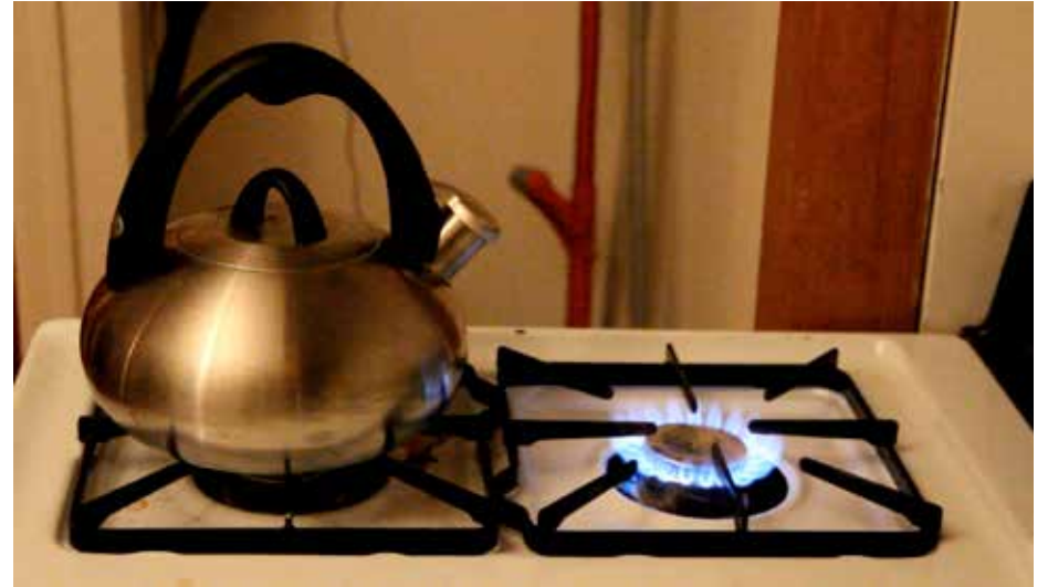
"ÇAYANLIK", 2012, VIDEO, 3+2AP "TEAPOT", 2012, VIDEO, 3+2AP