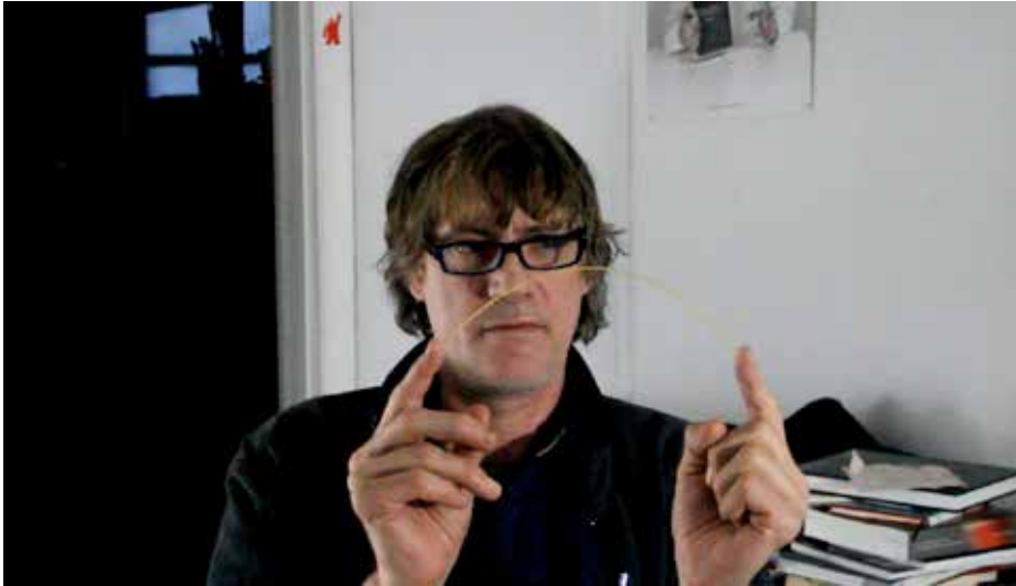
"MARK", 2011, VIDEO, 3+2 AP "MARK", 2011, VIDEO, 3+2 AP