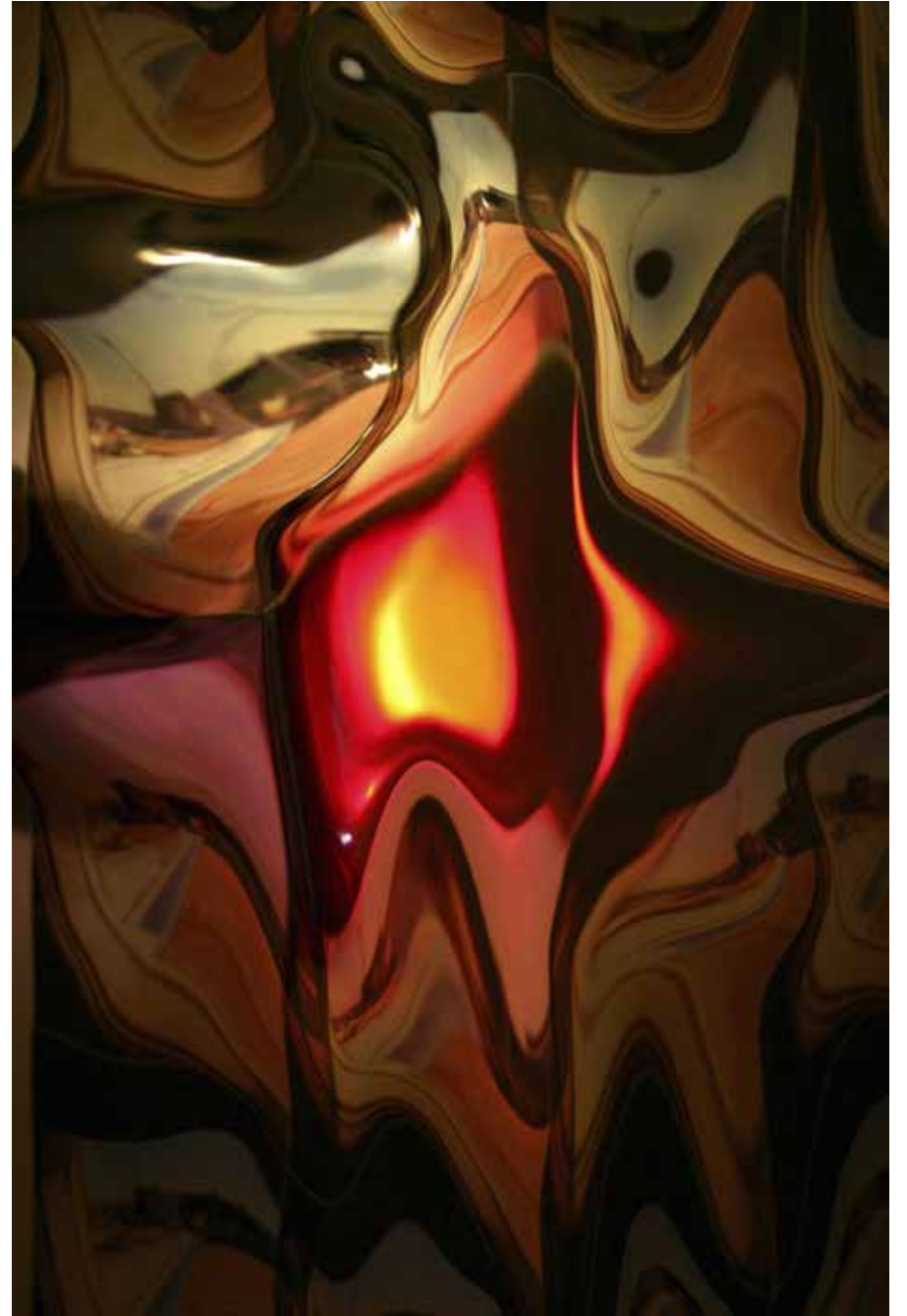
"MY HEART", 2012, KROMOJENİK BASKI, ALÜKOBOND ÜZERİNE DİASEC, 150X100CM, 3+1 AP "MY HEART", 2012, CHROMOGENIC PRINT, DİASEC, 150X100CM, 3+1 AP