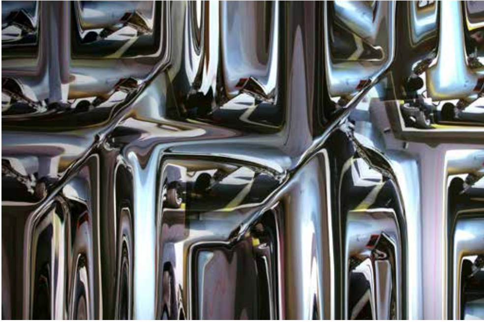
"JUNGLE", DİPTİK, 2013, KROMOJENİK BASKI, ALÜKOBOND ÜZERİNE DİASEC, (HERBİRİ) 100X150CM, 3+1 AP "JUNGLE", DİPTİK, 2013, CHROMOGENIC PRINT, DIASEC, 100X150CM (EACH), 3+1 AP