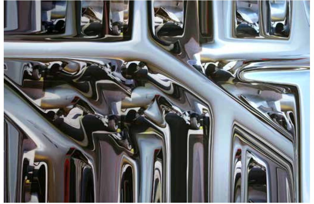
"JUNGLE", DİPTİK, 2013, KROMOJENİK BASKI, ALÜKOBOND ÜZERİNE DİASEC, (HERBİRİ) 100X150CM, 3+1 AP "JUNGLE", DİPTİK, 2013, CHROMOGENIC PRINT, DIASEC, 100X150CM (EACH), 3+1 AP