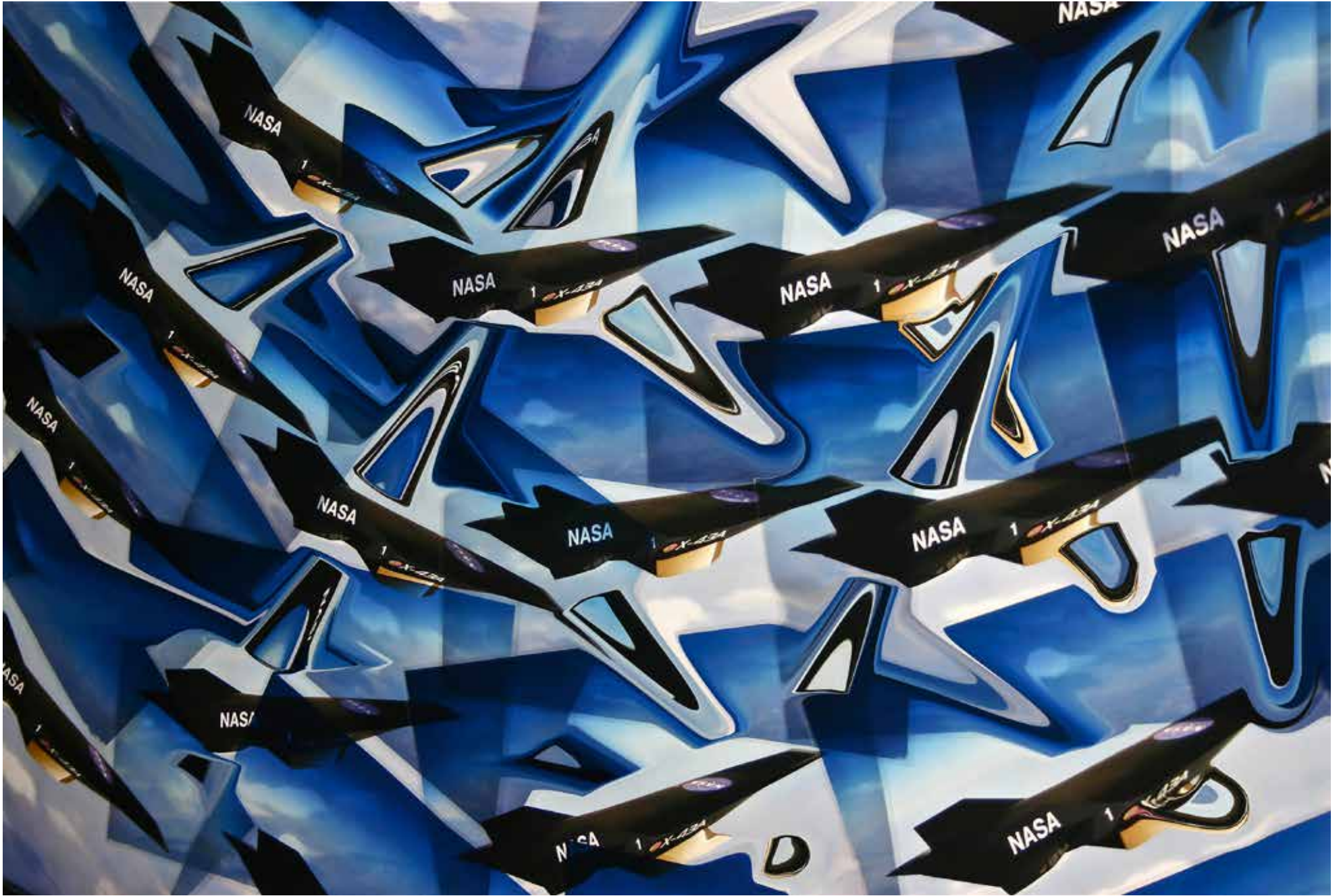
"İsimsiz 3", 2012, KROMOJENİK BASKI, ALÜKOBOND ÜZERİNE DİASEC, 110X165CM, 3+1 AP "UNTITLED 3", 2012, CHROMOGENIC PRINT, DİASEC, 110X165CM, 3+1 AP