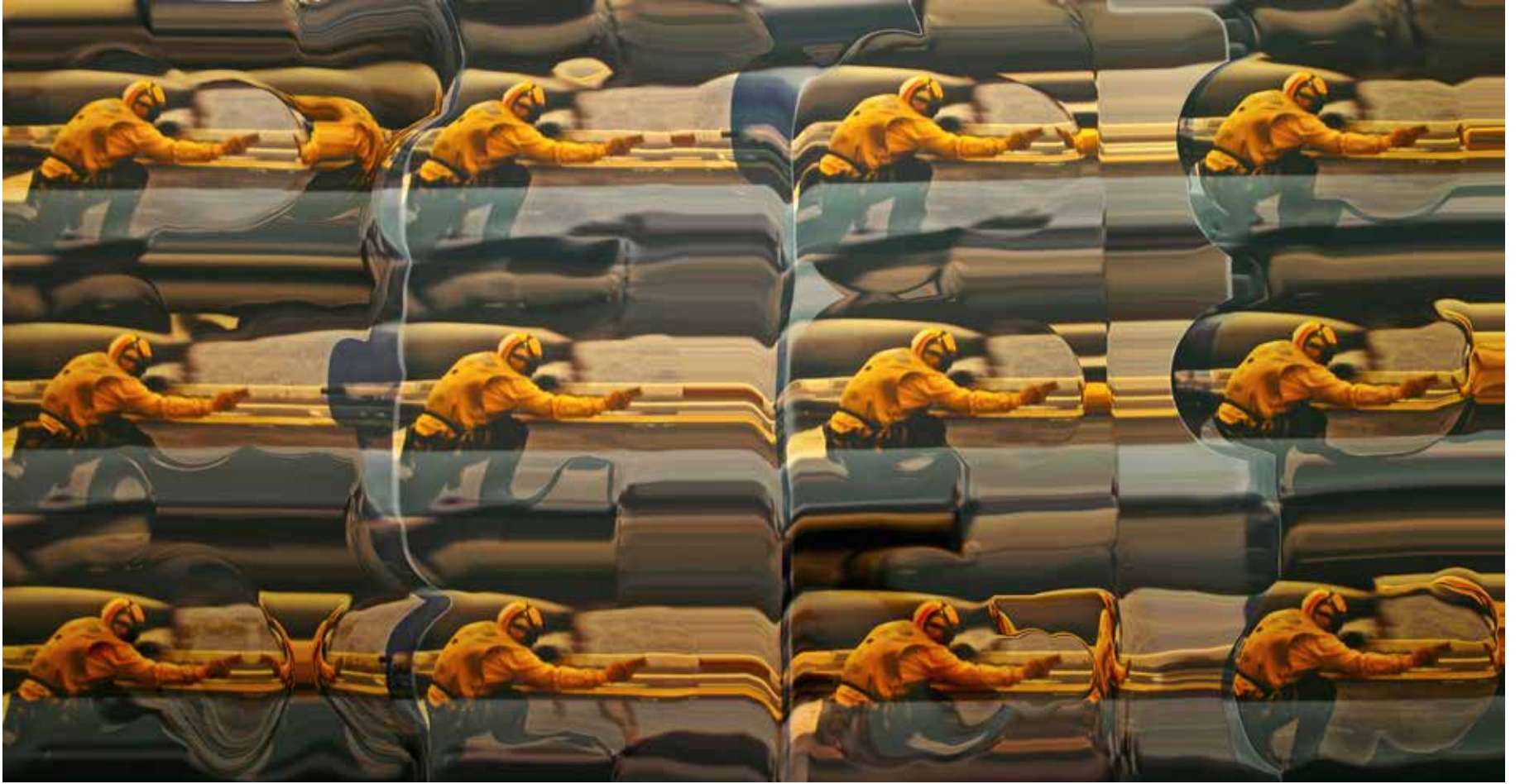
"İSİMSİZ 4", 2012, KROMOJENİK BASKI, ALÜKOBOND ÜZERİNE DİASEC, 100X192CM, 3+1 AP "UNTITLED 4", 2012, CHROMOGENIC PRINT, DIASEC, 100X192CM, 3+1 AP