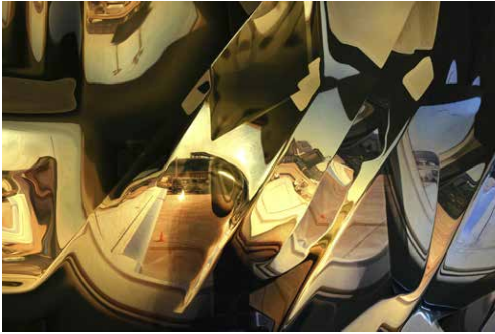
"İsimsiz 6", DIPTİK, 2013, KROMOJENİK BASKI, ALÜKOBOND ÜZERİNE DİASEC, (HERBİRİ) 80X120CM, 3+1 AP "UNTITLED 6", DYPTIC, 2013, CHROMOGENIC PRINT, DİASEC, 80X120CM (EACH), 3+1 AP