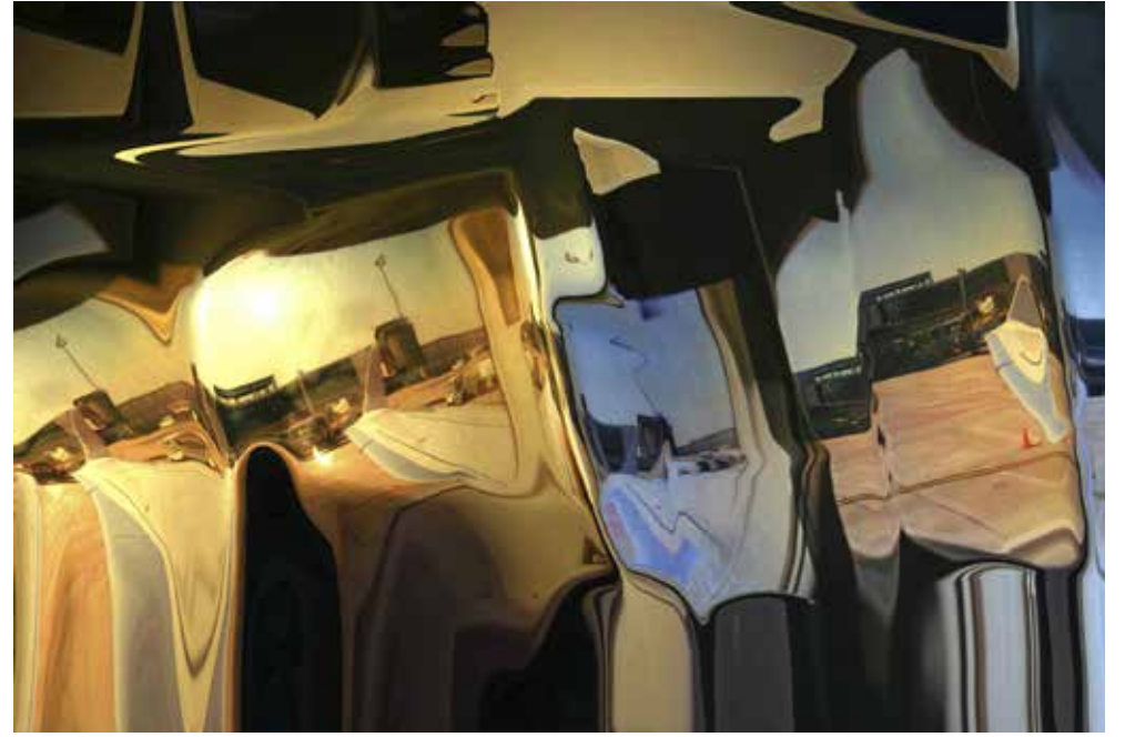
"İsimsiz 6", DIPTİK, 2013, KROMOJENİK BASKI, ALÜKOBOND ÜZERİNE DİASEC, (HERBİRİ) 80X120CM, 3+1 AP "UNTITLED 6", DYPTIC, 2013, CHROMOGENIC PRINT, DİASEC, 80X120CM (EACH), 3+1 AP