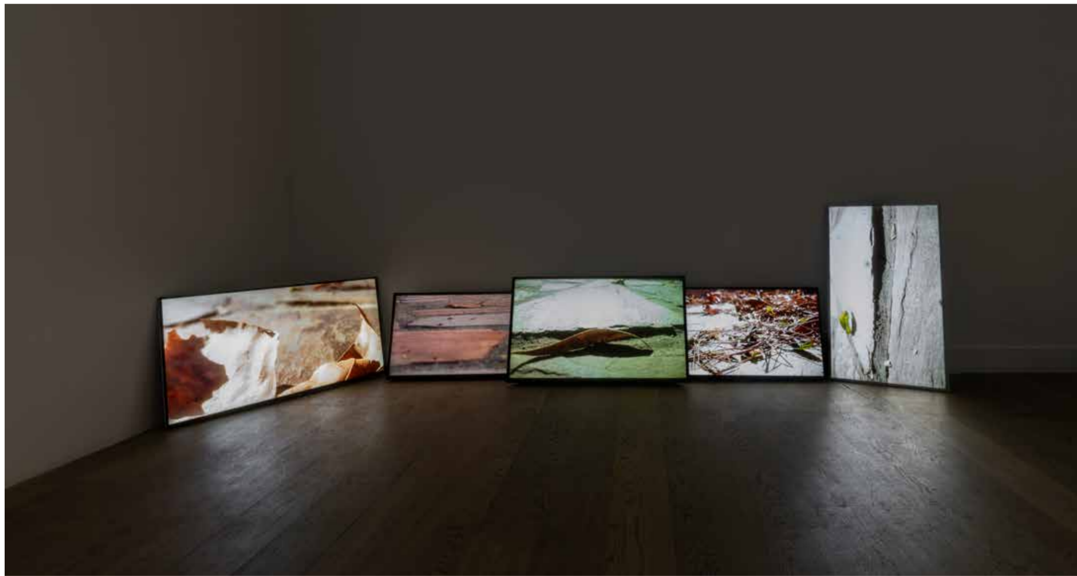
Gelecek Üzerine , 2023, Tek kanallı video, renk, ses, loop, Ed. 3 + 1 AP On Future , 2023, Single channel video, colour, sound, loop, Edition of 3 + 1 AP Rüzgarlı Natürmort , 2023, Beş kanallı video yerleştirme, renk, ses, loop, Ed. 3 + 1 AP Windy Nature Morte , 2023, Five channel video installation, colour, sound, loop, Edition of 3 + 1 AP