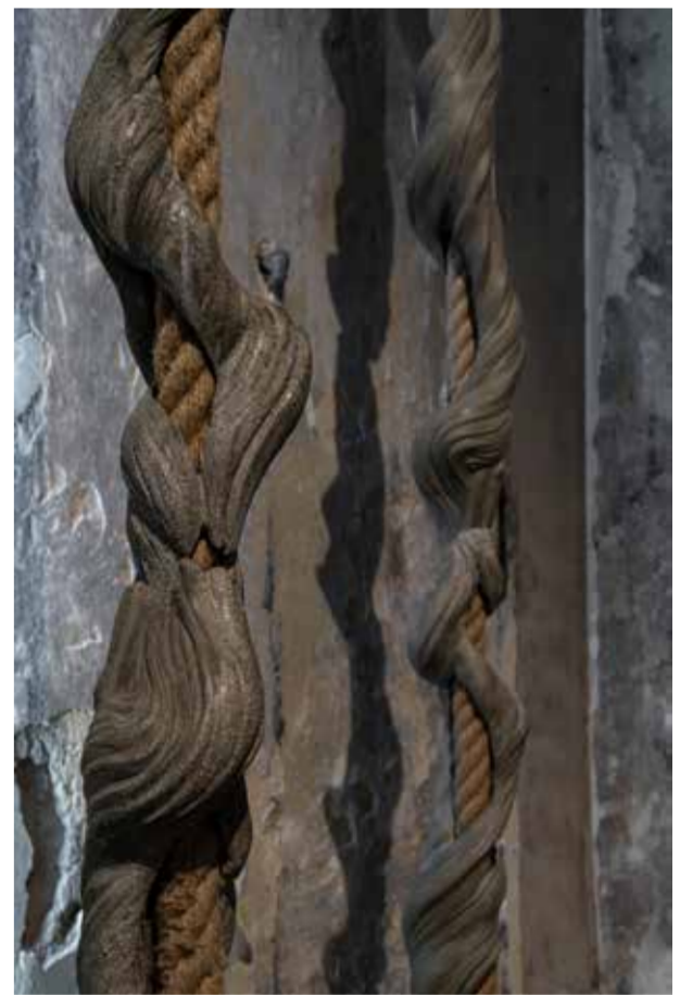
Tulya , 2024, Tuval üzerine marulfe kağıt, karakalem ve toz allık, 140 x 220 cm Tulya , 2024, Charcoal and powder blush on paper, mounted on canvas, 140 x 220 cm